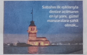
Sabahın ilk ışıklarıyla denize açılmanın en iyi yanı, güzel manzaralara şahit olmak...

"Balıkçıları nasıl anlatayım sana. Candan insanlar. Deniz adamı kötülük bilmez. Sağlam karakterlidir genelde. Ailenin çocuklarını koruması gibi balıkçılar birbirini korurlar. Telefon etsen koşar gelirler. Teknen bozulduysa her işini bırakır gelir. Denizde bu bir kuraldır" diyen usta kaptan ile yorucu geçen deniz macerasını geride bırakarak, Kadıköy'ümüze dönüyoruz.